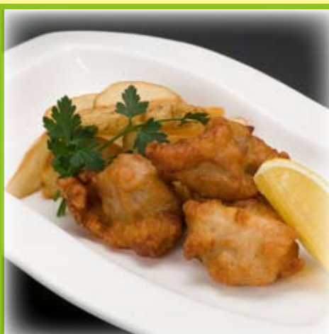
唐揚げとポテトの盛合せ 500円