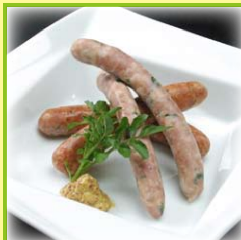
八幡平市産ほうれん草と 行者にんにくソーセージ 500円