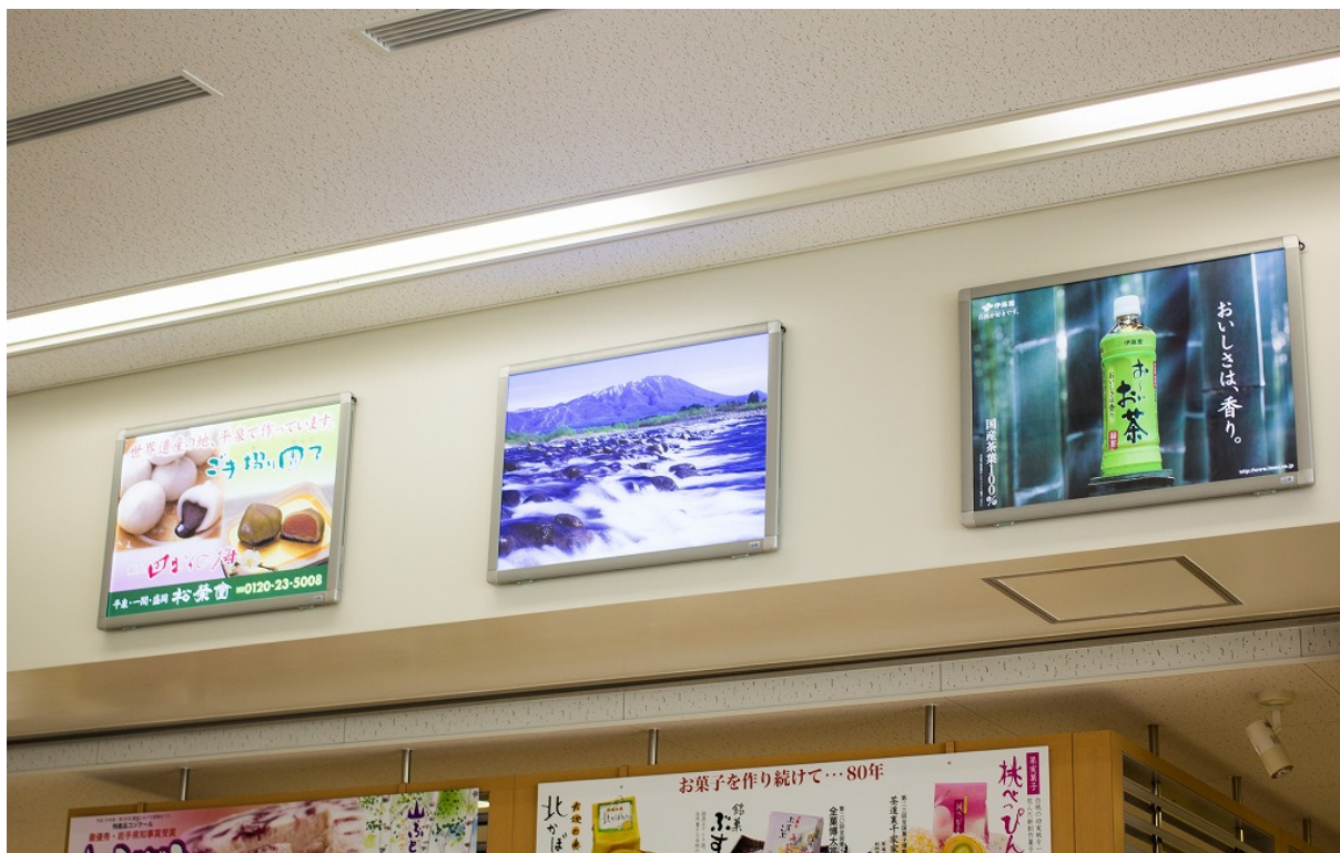
電照式広告掲出例