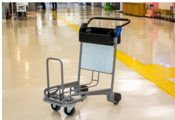
プッシュカート写真例